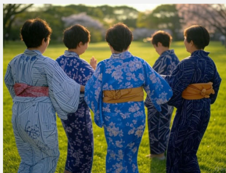
演舞の練習・発表