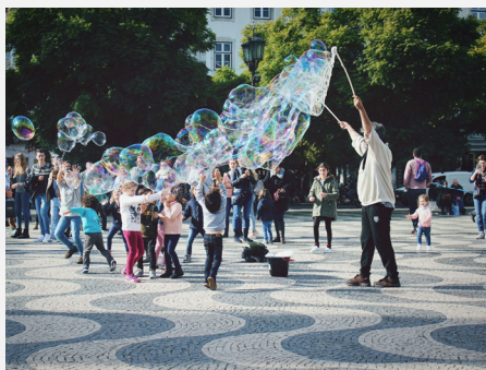
子ども向けワークショップ